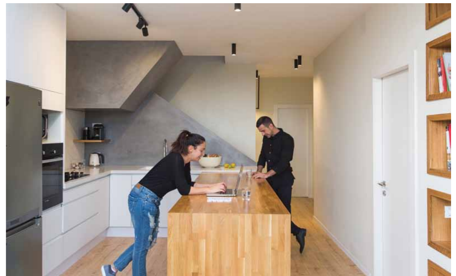
▲ הבוזר כאלמנט רב שימושי מעץ טבעי