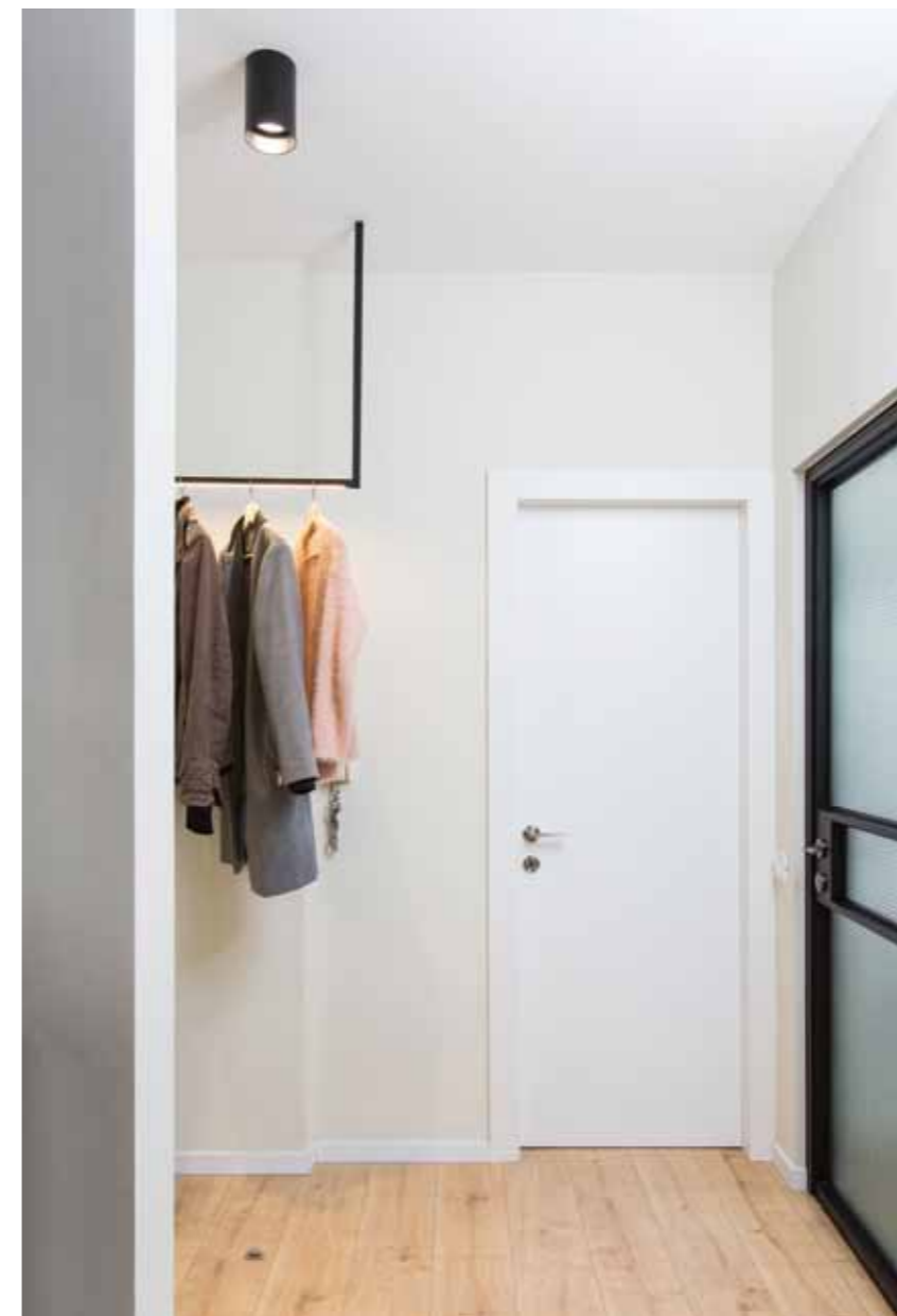
▲ מתלה המעילים שמזכיר בוטיק אופנה יוקרתי משאיר חותם כבר בכניסה לבית

הצבעים השולטים הם הלבן של החלל כולו, בשילוב של המדרגות בטון אפרפר וצבע השחור שחיים בהרמוניה לצד העץ הטבעי של המטבח שיוצר מנגרות אמנותיות. להשלמת ההרמוניה מתחברים גם מכשירי החשמל המשלבים אלומיניום ושחור ביחד עם גופי התאורה שגם הם מקינים אווירה של דירת בוטיק. בהמשך למטבח ממוקמת פינת האוכל שבתוך החלל הלבן נשארת עם אווירה חמימה ומזמינה כשאפקט החלל הכפול מעל ביחד עם החלון לכל האורך נותנים תחושה של כמעט לשבת בחוף בטבע עם הספסל והשולחן מעץ שאף מזכירים קמפינג אבל בסטייל.