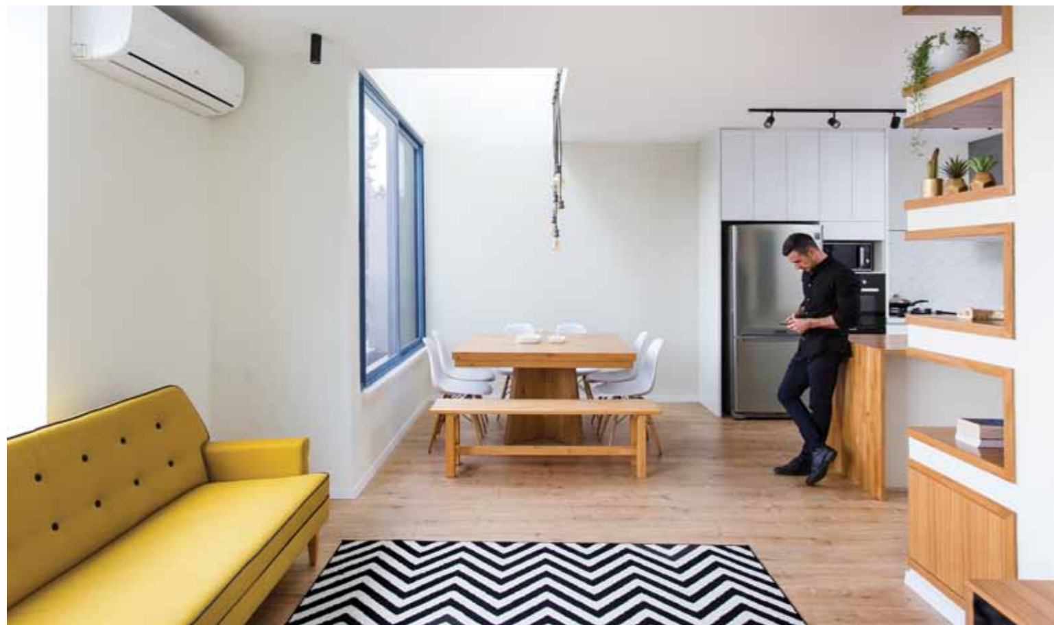
▲ כמעט כמו לשבת בטבע. פינת האוכל המוארת עם ספסל מעץ טבעי בסטייל

הצבעים השולטים הם הלבן של החלל כולו, בשילוב של המדרגות בטון אפרפר וצבע השחור שחיים בהרמוניה לצד העץ הטבעי של המטבח שיוצר מנגרות אמנותיות. להשלמת ההרמוניה מתחברים גם מכשירי החשמל המשלבים אלומיניום ושחור ביחד עם גופי התאורה שגם הם מקינים אווירה של דירת בוטיק. בהמשך למטבח ממוקמת פינת האוכל שבתוך החלל הלבן נשארת עם אווירה חמימה ומזמינה כשאפקט החלל הכפול מעל ביחד עם החלון לכל האורך נותנים תחושה של כמעט לשבת בחוף בטבע עם הספסל והשולחן מעץ שאף מזכירים קמפינג אבל בסטייל.